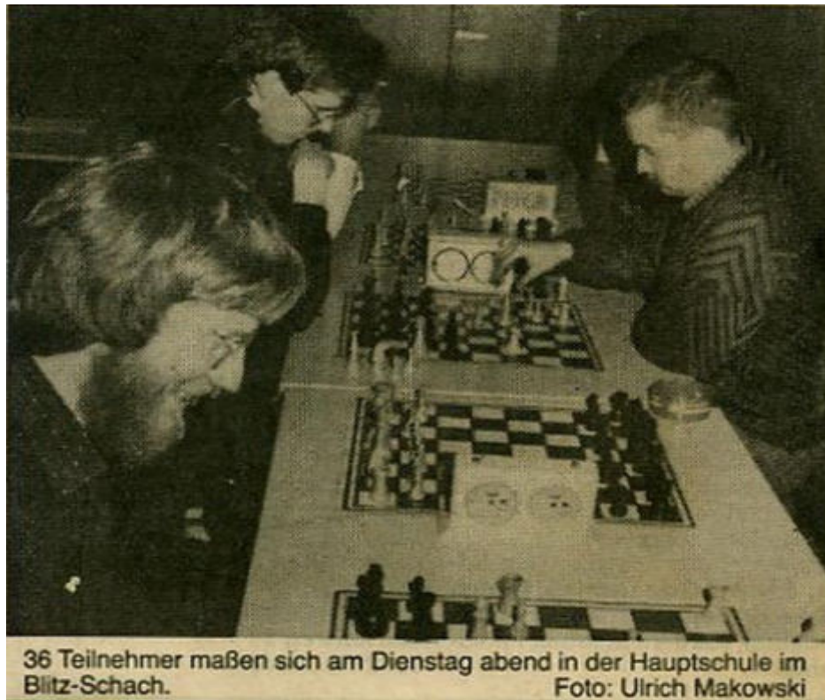
36 Teilnehmer maßen sich am Dienstag abend in der Hauptschule im Blitz-Schach.