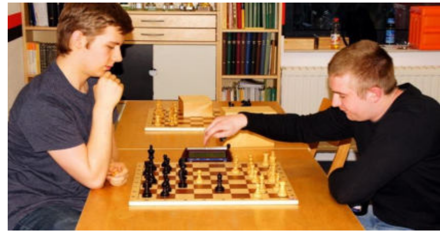
die Entscheidungspartie oben um Platz 1