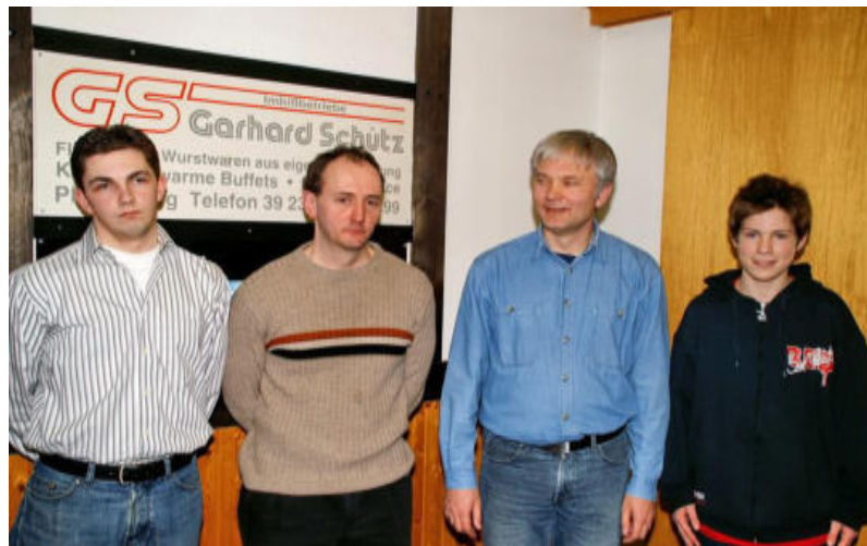
die vier erstplatzierten Senioren 2005/06