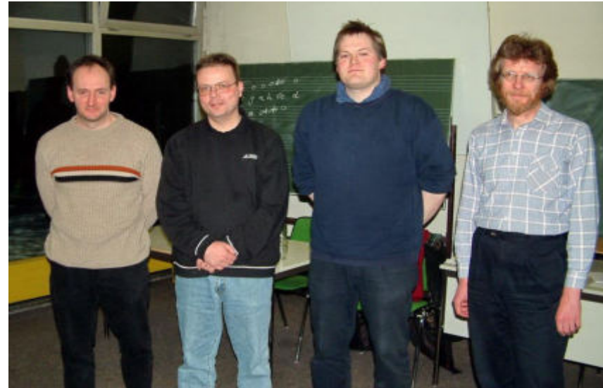
die vier Erstplatzierten 2004/05