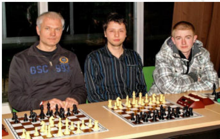
die drei Erstplatzierten 2010/11