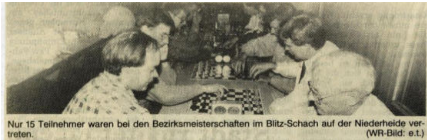
Nur 15 Teilnehmer waren bei den Bezirksmeisterschaften im Blitz-Schach auf der Niederheide vertreten.