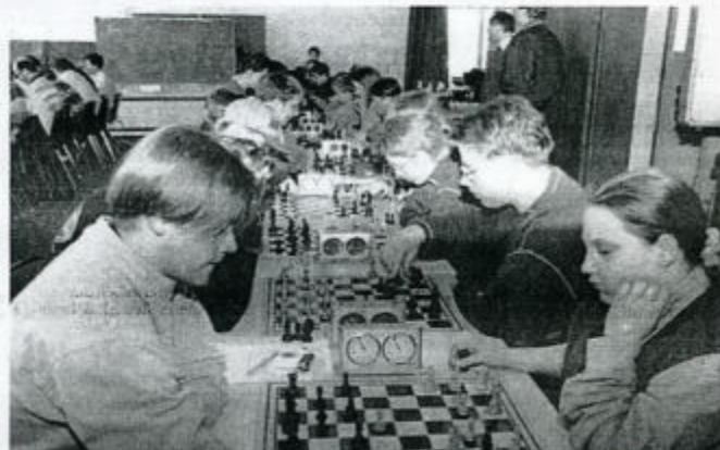
In der Hauptschule trafen sich am Samstag die Schachspieler des Bezirkes zur Blitzmeisterschaft. Die Veranstalter freuten sich über einen ausgesprochen guten Besuch.

Neuenrade. Anlässlich ihres 25-jährigen Vereinsjubiläums richteten die Schachfreunde Neuenrade in diesem Jahr einige überregionale Turniere aus. So fand am Samstag das erste, nämlich die Blitzmeisterschaft des Schachbezirks Sauerland für Senioren und Jugendliche, in der Hauptschule Niederheide statt. Der nicht erwartete Massenandrang verursachte bei den Neuenrader Veranstaltern einiges Kopfzerbrechen, denn es mußten insgesamt 59 Teilnehmer untergebracht werden. Wenn es auch eng und nicht immer so leise abging, wie es Schachspieler eigentlich gewohnt sind, wurden die Blitzmeisterschaften doch harmonisch abgewickelt.