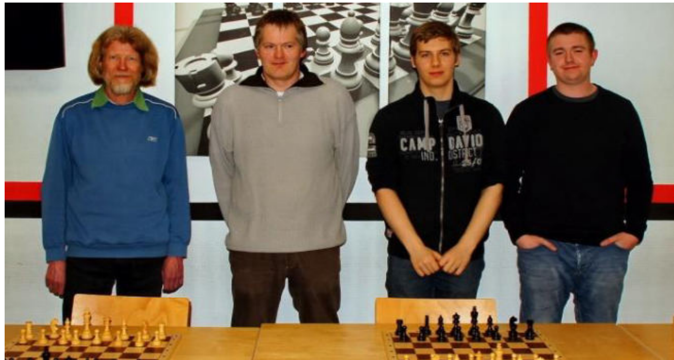
die vier Qualifikanten für Südwestfalen